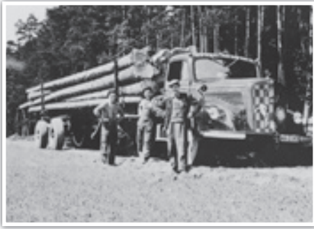
Mercedes L 6600: Mit seinem selbstlenkendem Zweiachs-nachläufer war der Lastwagen eigens für Langholztransporte ausgelegt