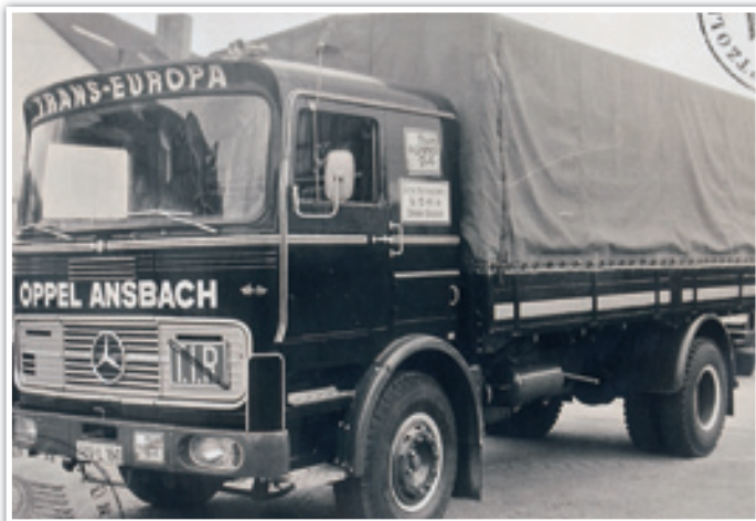
Die Mercedes LP 1620 wurden meist ohne Fahrerhaus gekauft und dann mit eigens dafür angefertigten Fahrerkerabinen von Doll ausgestattet