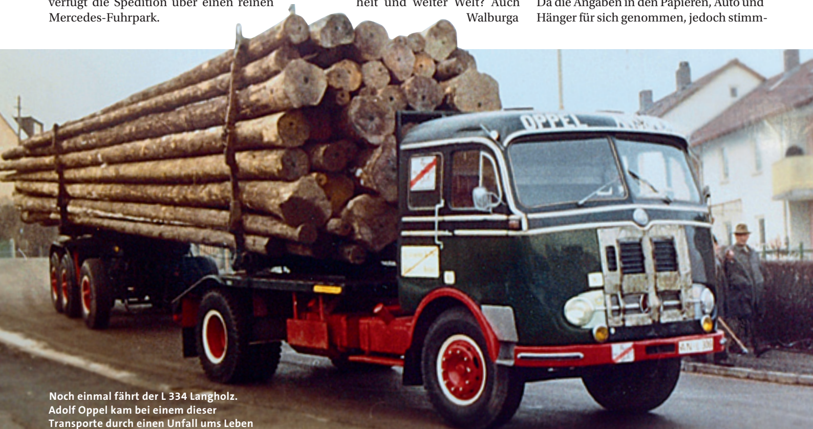
Noch einmal fährt der L 334 Langholz. Adolf Oppel kam bei einem dieser Transporte durch einen Unfall ums Leben

torwagen, war im Normalfall bei je 12 Tonnen für Auto und Anhänger Schluss. Hing man allerdings einen alten Dreiaxshänger an den Tausendfüßler, kam man schon mal auf 27 Tonnen Nutzlast beziehungsweise 40 Tonnen Gesamtgewicht. Da die Angaben in den Papieren, Auto und Anhänger für sich genommen, jedoch stimm-