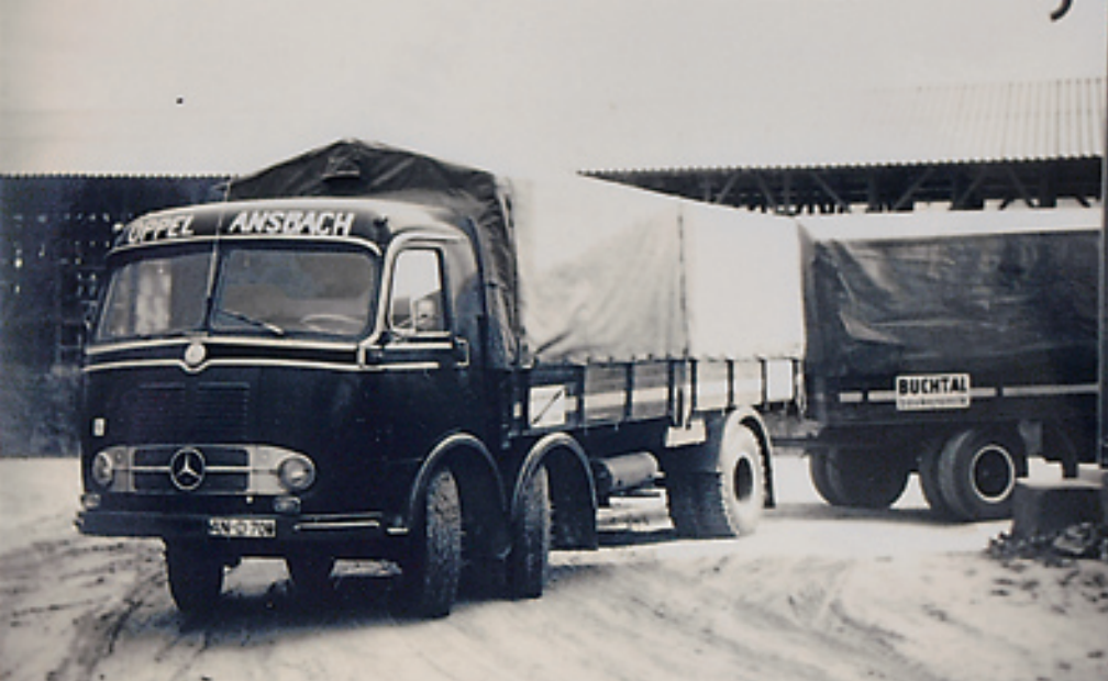
Mit dem „Tausendfüßler“ steigt die Firma Oppel in den Fernverkehr ein. Der LP 333 mit seinen zwei gelenkten Vorderachsen war die Mercedes-Antwort auf die ungeliebte Achslastbeschränkung