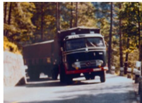
Der LP 334-Lastzug schnauft eine Passstraße hinauf. Nach dem Ende der Langholztransporte stieg die Firma verstärkt in den Fernverkehr ein