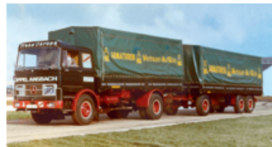
„Vertrauen auf Güte“ – ein Slogan, der sich ohne weiteres auch auf das für seine Zuverlässigkeit bekannte Transportunternehmen anwenden lässt

tion, die etwa 40 Lkw im bundesweiten Fernlastverkehr sowie eine Lagerhaltung mit 8000 Palettenstellplätzen umfasst, sind 70 Mitarbeiter tätig. Es ist eine stolze Bilanz, nein, eine Zwischenbilanz, die die aufstrebende Firma vorweist. Ordnung, Sauberkeit, Pünktlichkeit, dazu Disziplin und Zuverlässigkeit – kein Zweifel: Im Hause Oppel weiß man diese scheinbar altmodischen Tugenden der Vorväter auch weiterhin zu schätzen.