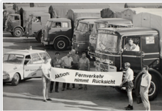
Ordnung, Disziplin und Verkehrssicherheit: Mit Fug und Recht bricht die Firma bei dieser Imagekampagne eine Lanze für den Fernverkehr