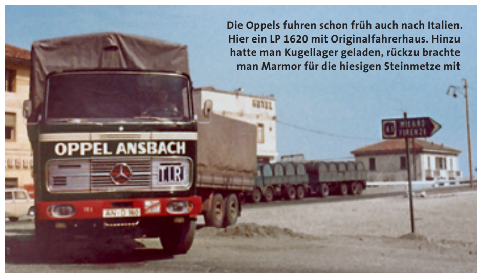
Die Oppels fuhren schon früh auch nach Italien. Hier ein LP 1620 mit Originalfahrerhaus. Hinzu hatte man Kugellager geladen, rückzu brachte man Marmor für die hiesigen Steinmetze mit

Die Devise heißt fortan: Güterfernverkehr. Genehmigungen müssen eingeholt