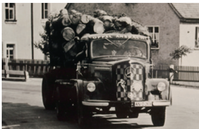
Langholztransporte waren lange Zeit ein angestammtes Geschäftsfeld der Firma Oppel. Hier der nagelneu gekaufte „90er“-Mercedes L 4500