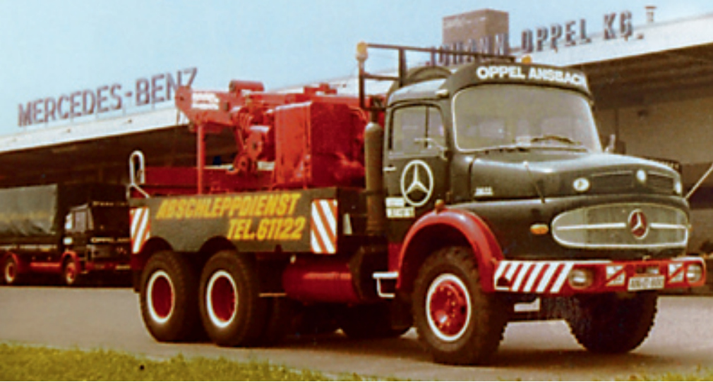
Auch der gehörte dazu: Abschleppwagen LK 2633 mit 6x4-Antrieb. Das 230 PS starke Auto verfügt über 13.750 ccm Hubraum und verkräftet ein zulässiges Gesamtgewicht von 26 Tonnen