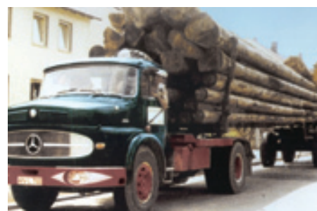
Josef und Gertraud Oppel mit einem schwerbeladenen L 334. Unvorstellbar, welche Lasten die Lkw früher schon beförderten