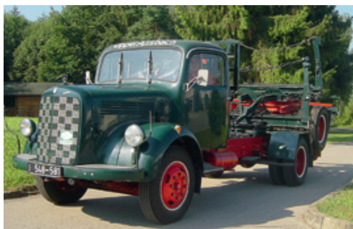
Mit den Mercedes ging die Einführung der Hausfarbe „Opelgrün“ und des Firmenschriftzugs einher. Der L 311 blieb als Oldtimer erhalten